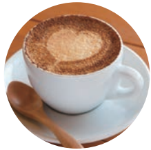
黒蜜きなこカプチーノ