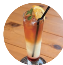
トリプルセパレートティー