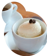
ジェラートコンカフェ