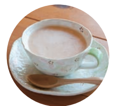
王様のミルクティー

てくてくてくてく。メイちゃんと、りすさんが歩いていると 遠くに大きな木が見えてきました。