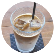
アイス豆乳カフェラテ