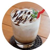
アイスカフェモカ