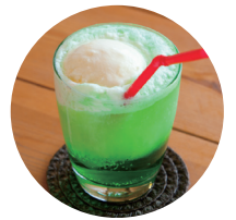
メロンクリームソーダ