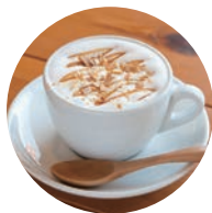
キャラメルアーモンド